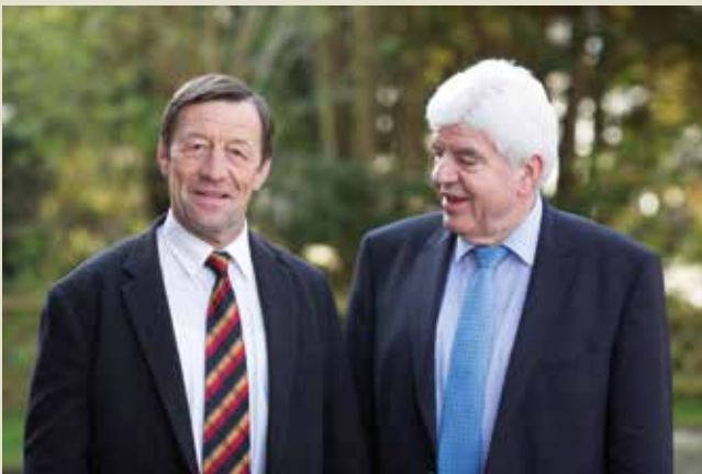
Kreistagskandidat für das obere Lahntal und Erndtebrück